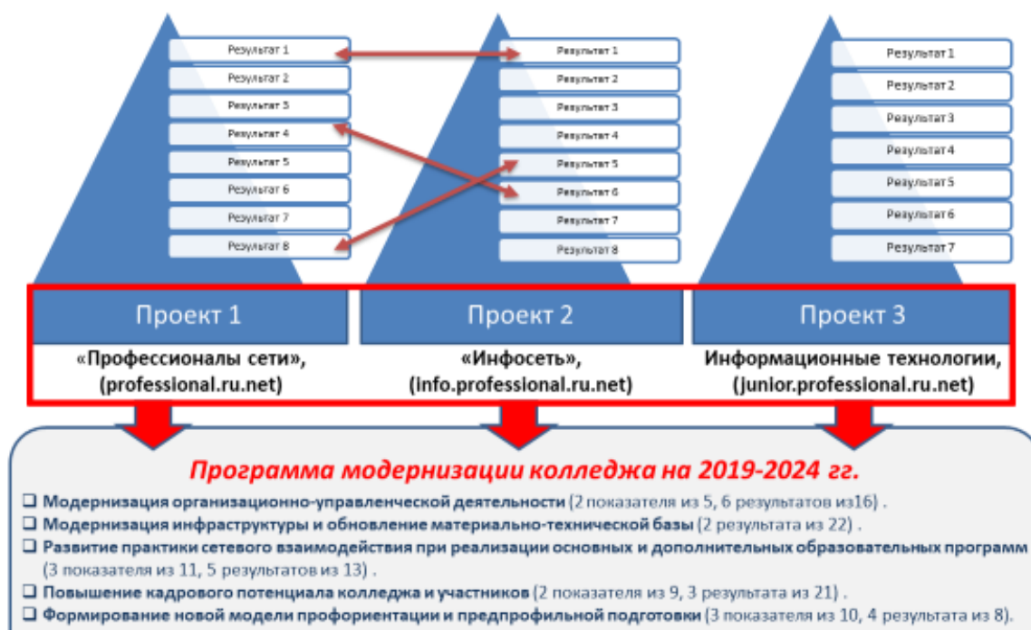
Рисунок 5.2.1 - Графическая модель функционирования результатов проектов

Реализация проектов позволит совершенствовать практику сетевого взаимодействия между ГБПОУ «ПГК», ПОО региона, ЦПО, школами, а также промышленными предприятиями и организациями посредством включения в содержание Программы модернизации показателей и результатов проектов.