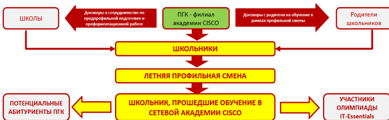
Рисунок 3.1.3.10. – Модель функционирования результатов проекта 3

8. Таким образом, в 2020 году планируется в рамках летних профильных смен обучить 50 школьников, а в 2021 - 150 школьников.