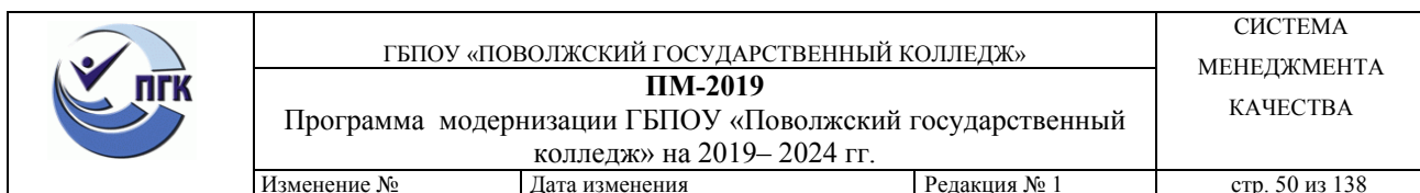
Таблица 1.3.1.2. Анализ возможностей и угроз внешней среды ГБПОУ «ПГК»