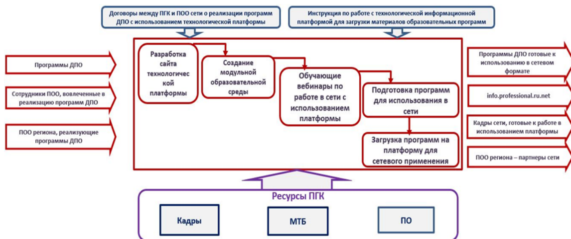
Рисунок 3.1.2.10. – Модель функционирования результатов проекта 2

3. Таким образом, до конца 21 года платформа будет содержать в себе материалы и позволять реализовывать не менее 10 программ участникам сети - не менее 10 ПОО.