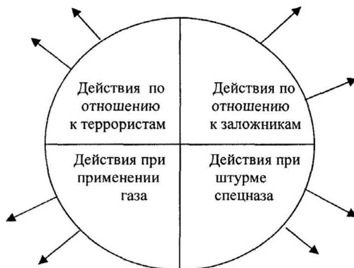
Схема - «кластер» «Безопасное поведение при захвате заложников»